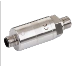
Aussengewinde G1/4" mit M12 x 1 Stecker