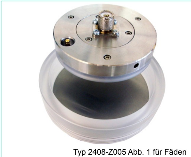
Typ 2408-Z005 Abb. 1 für Fäden