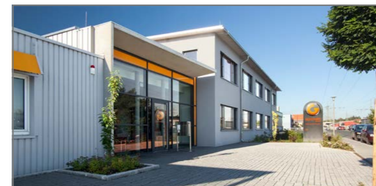
Unser Hauptsitz in Schwaig bei Nürnberg

Aktuell ist das GÜNTHER Kalibrierlabor für die Messgrößen Widerstandsthermometer und Thermoelemente im Bereich von -20°C bis 600°C akkreditiert. Für Temperaturen bis 1400°C arbeiten wir mit einem Partnerlabor zusammen, das bis 1400°C akkreditiert ist. Die Erweiterung der Zulassung auf den Bereich von -80°C bis 1300°C ist bereits in Arbeit.