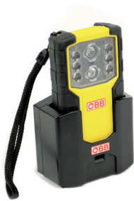
TorchLED Entwicklungsprojekt Gifas CH