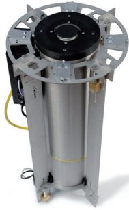
Senkpoller Entwicklungsprojekt Gifas CH