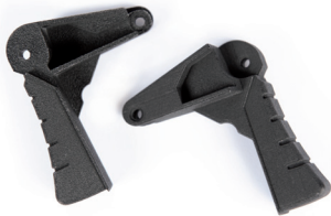
Messzangengriff Kostenreduktionsprojekt Gutor USV