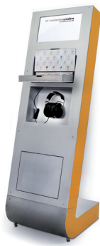
Hörtower Entwicklung / Konstruktion Audito Suisse